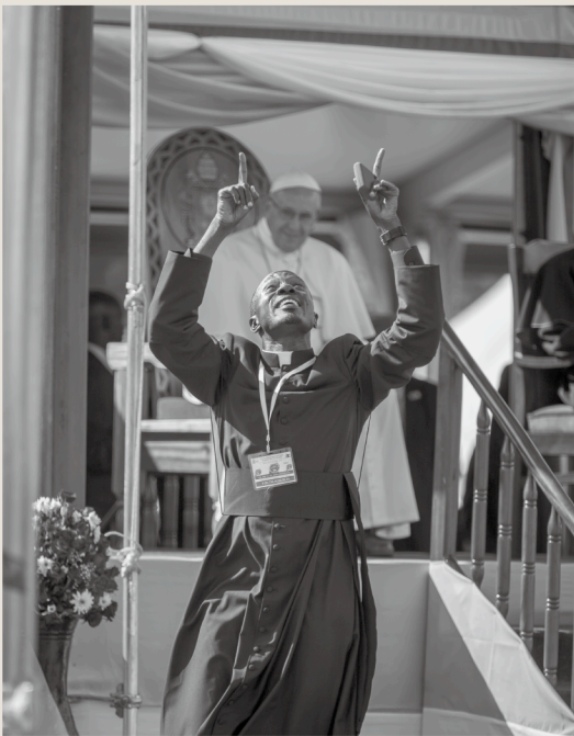
「ローマ法王に祝福を受けたカトリック神父」 カンバラ、ウガンダ、2015年11月29日

野党派の大統領候補者キザ・ベンジエの演説会で、機動隊によって発射された催涙弾から逃げ去る大学生達。演説前にベンジエは警察に逮捕され、集会がデモにエスカレート。1人が射殺された。