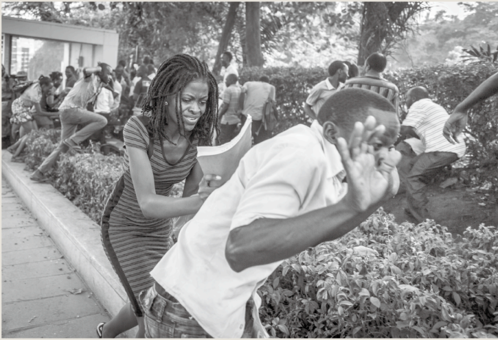
「混迷の大統領選挙」 カンバラ、ウガンダ、2016年2月15日